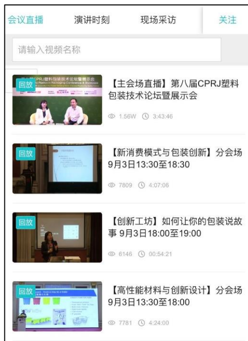
选择主会场或分会场